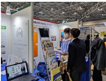
エコプロ 2022 出展の様子

第 4 回 聖学院 SDGs コンテスト PHOTO&MOVIE 部門の優秀作品の展示を行います。聖学院は児童、生徒、学生、教職員他、聖学院関係者対象の写真と動画のコンテストを実施しています。今年のテーマは「教えてあなたの SDGs」。凡そ 230 作品の応募があった中から最優秀賞を受賞したのはなんと小学生の作品でした。