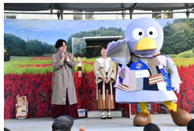
県庁オープンデー