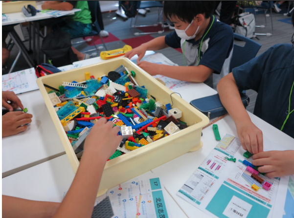
2022年レゴキング選手権の様子