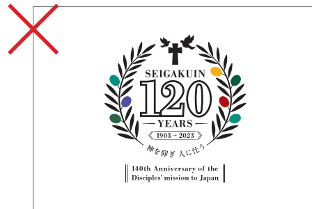
アウトライン化の禁止