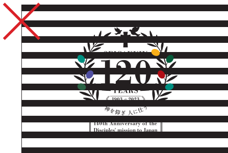
視認性を低下させる背景上への使用禁止