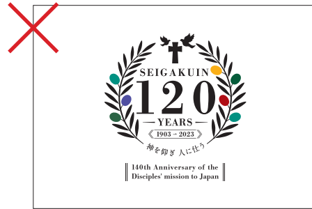
文字間隔変更の禁止