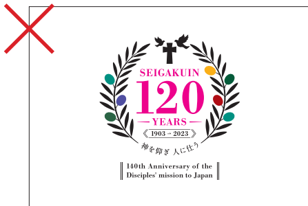
指定外の色での表示禁止