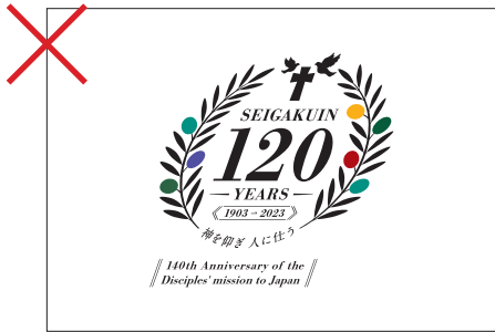
上下左右の比率変更や斜体加工の禁止